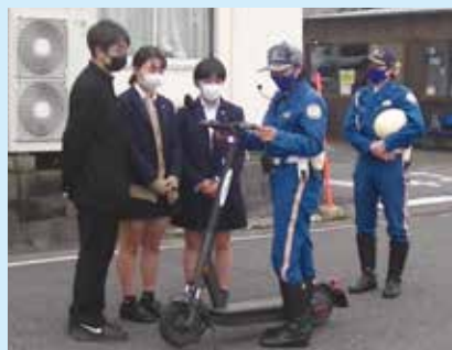
電動キックボード体験講習会の様子 / 学校交通安全教育「スタートかながわ」モデル校の皆さんが協力してくれました。